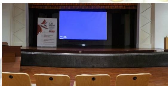
圖 6-1 衡道堂－小禮堂之舞台

官方網站： http://tccip.boch.gov.tw/tccp/main.php?page=site