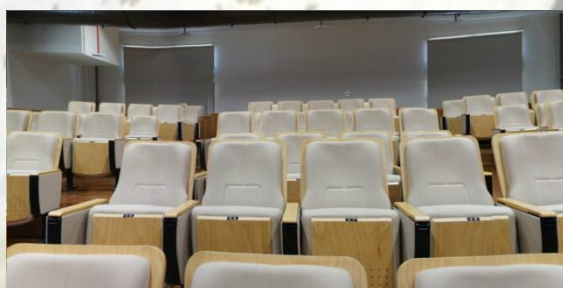
圖 6-2 衡道堂－小禮堂之座位