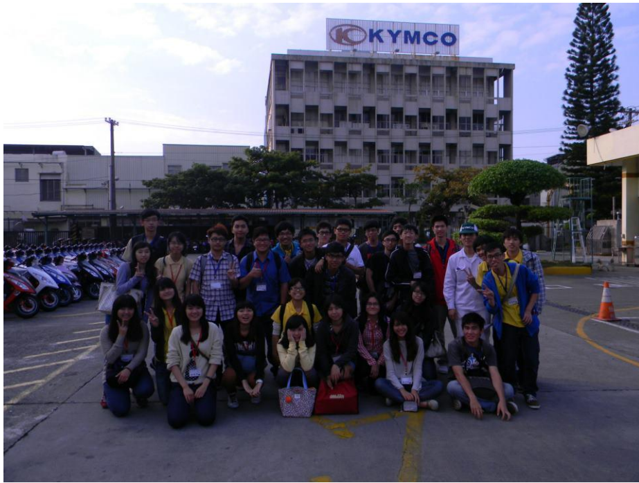
↑ 光陽機車公司工廠外部學員、志工、鄭大哥之合照