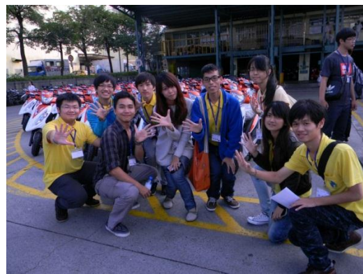
光陽公司－工作人員合照