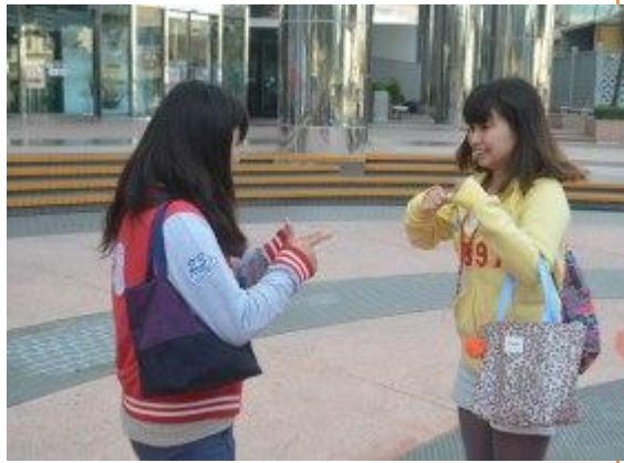
大遠百前廣場---破冰遊戲